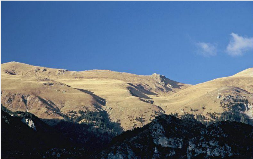
Attribution : JP MALAFOSSE - PNM