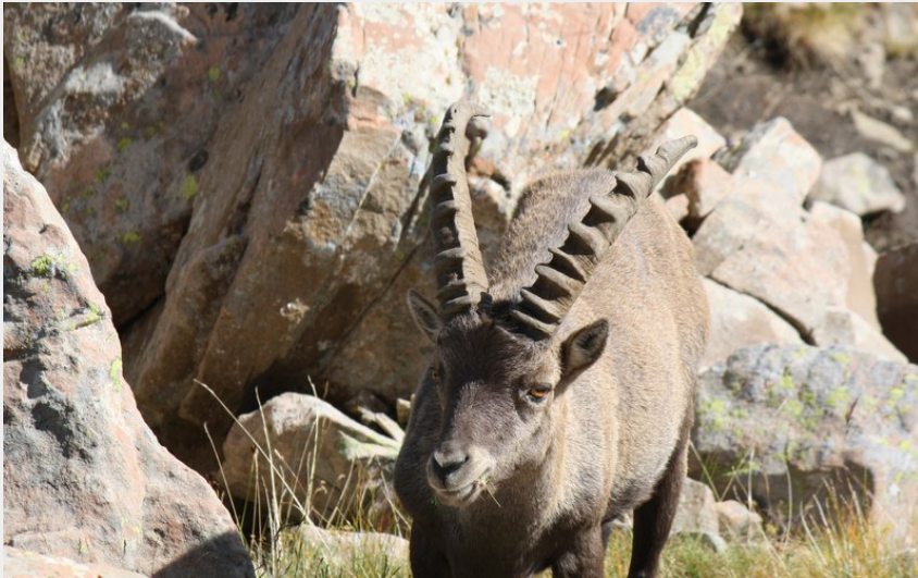
Attribution : Marc Aynie (Bouquetin)