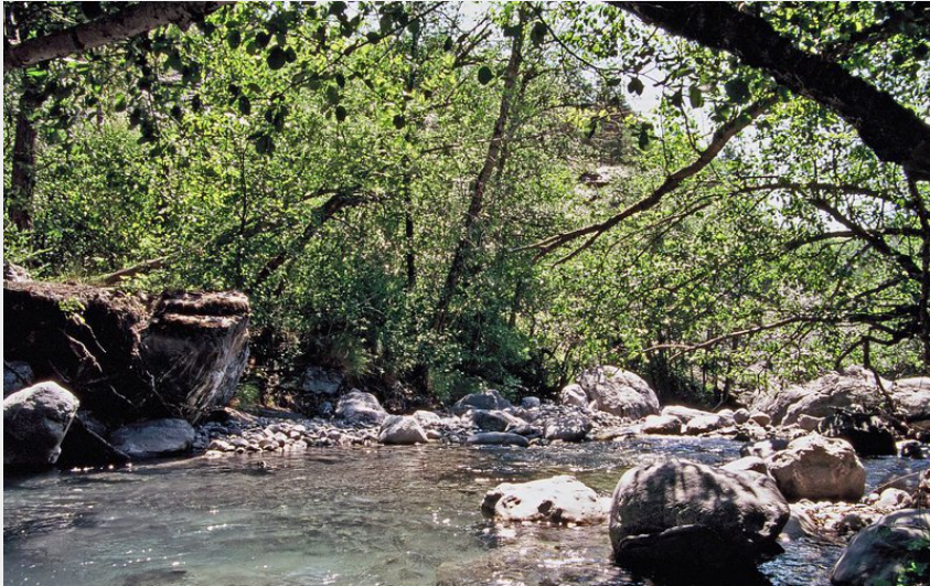
(Le torrent de la Barlatte dans le haut-Var-Cians, en milieu forestier)