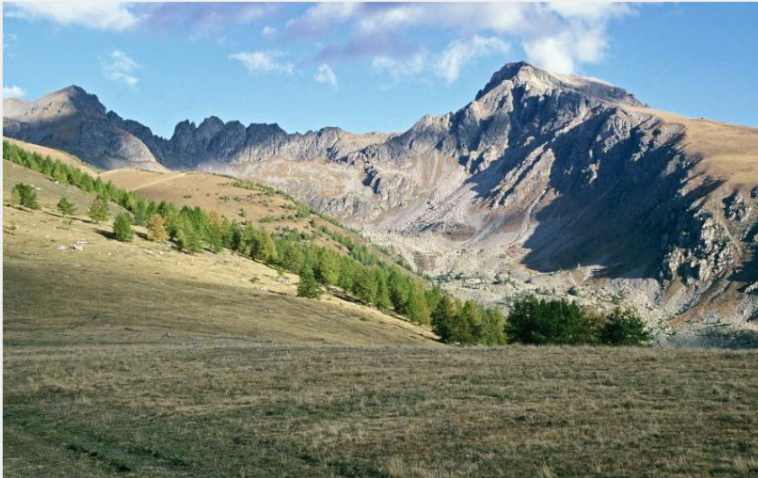
Attribution : Gilbert ROSSI (La Roche de l'Abyesse, (2756 m), en Roya.)