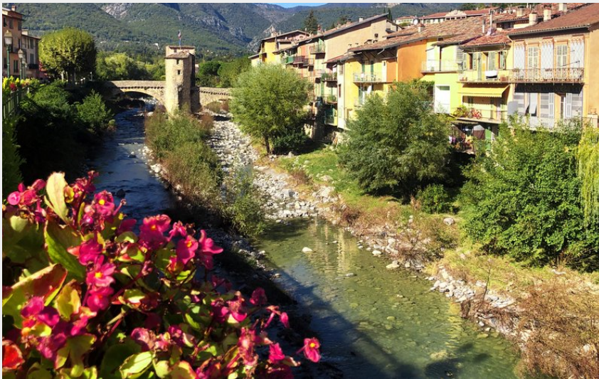
Attribution : Vue village (Andreia de Freitas)