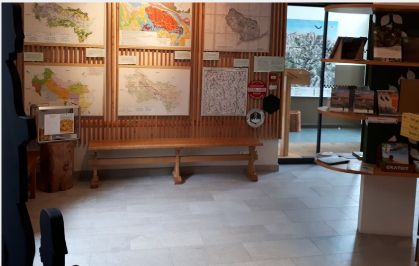
Attribution : Intérieur (Bureau Tende)