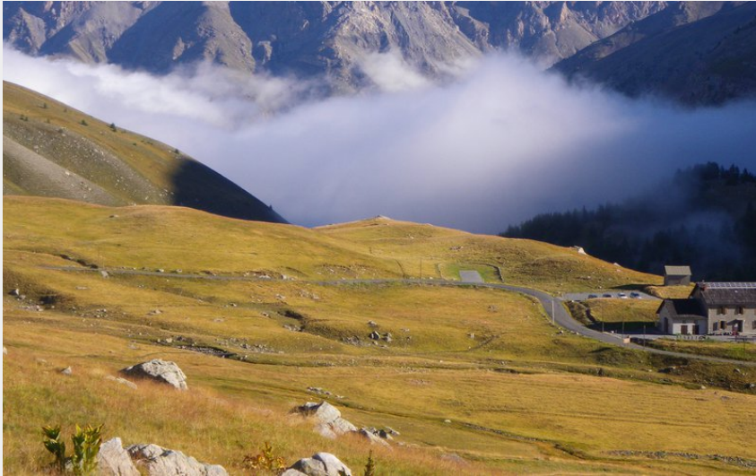
Attribution : Vue générale du refuge de la Cayolle (M. Bensa / PnM)