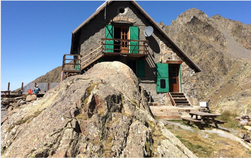
Attribution : rabuons (FFCAM)