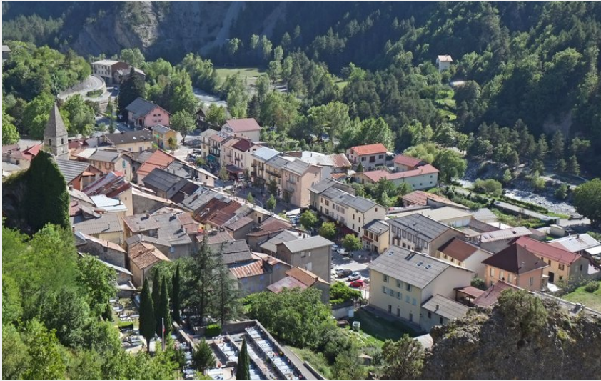
Attribution : vue depuis la route de Bouchanières (mairie de Guillaumes)