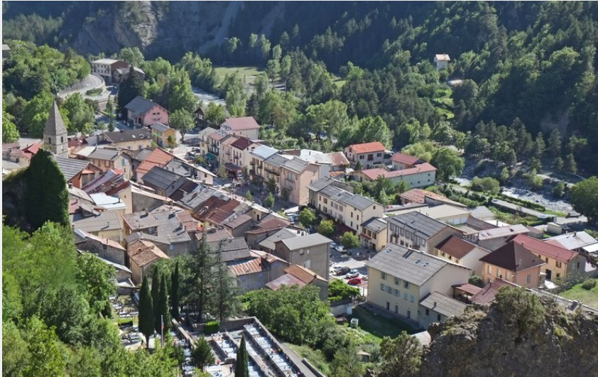
Attribution : vue depuis la route de Bouchanières (mairie de Guillaumes)