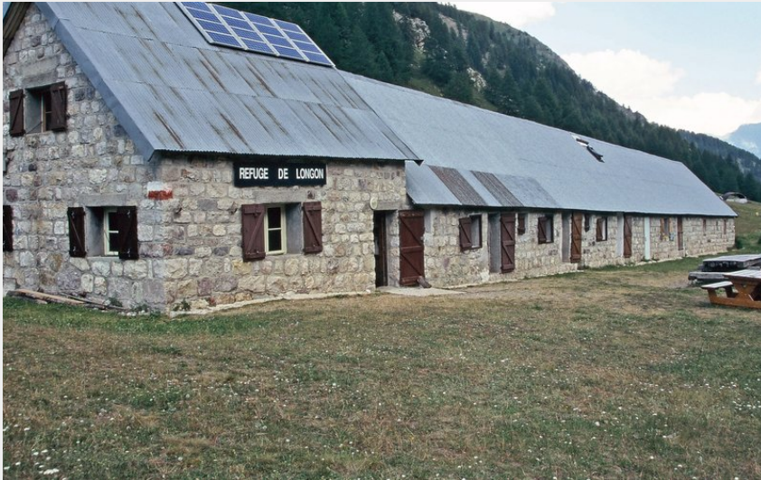
Vue extérieure du refuge de Longon