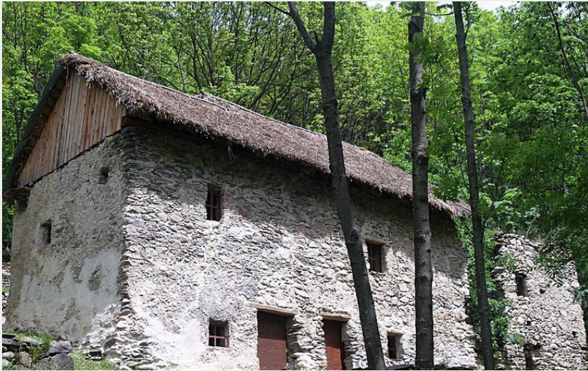
La casa a Tetti Bartola con tetto in paglia di segale (Roberto Pockaj)