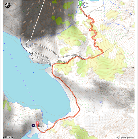
Il Bacino del Chiotas con al centro il Rifugio Genova (Roberto Pockaj)

C'est un itinéraire relativement court, comportant cependant quelques pentes assez raides, notamment dans la première moitié. Après une pente escarpée, accompagnée d'échelles métalliques et de mains courantes aidant à franchir les points les plus difficiles, c'est une route en terre battue plus agréable et facile qui continue jusqu'au refuge.