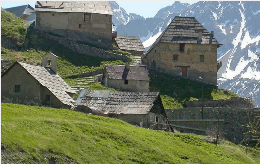
Le hameau de Bousiéyas au printemps. Névés en arrière plan.