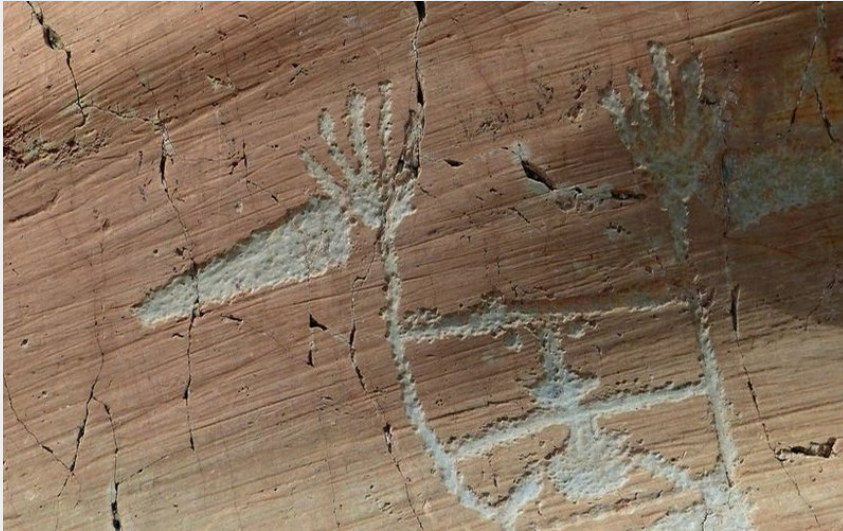
Gravure rupestre de la vallée des Merveilles, le Sorcier