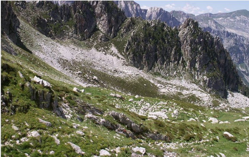
Il vallone che conduce a Porta Sestrera dal Rifugio Garelli (Roberto Pockaj)