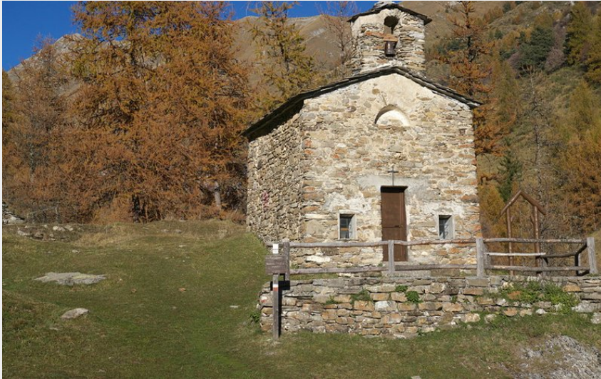
La Cappella della Madonna della Neve presso Upega (Roberto Pockaj)