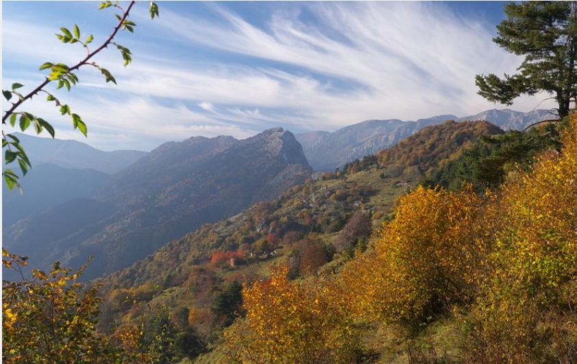
Panorama dai pressi della Madonna dei Cancelli (Roberto Pockaj)