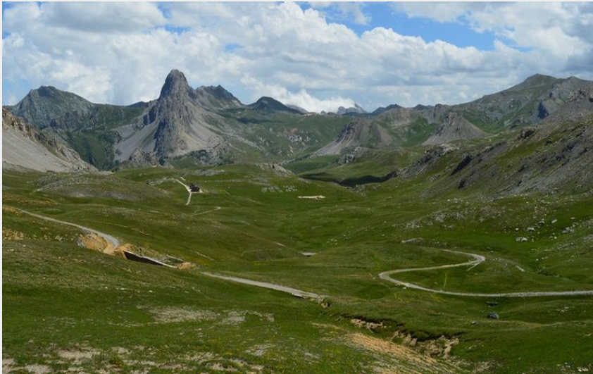
Gardetta et Rocca la Meja du Passo Gardetta (Fabrice Henon)