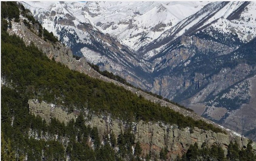
Randonnée Marguareis. Varnes et le Marguareis en hiver