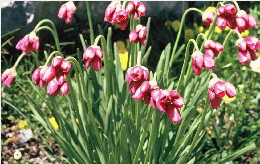
Randonnée Marguareis. Ail à fleurs de narcisse, ( Allium narcissiflorum ), dans le Marguareis, (2550 m).