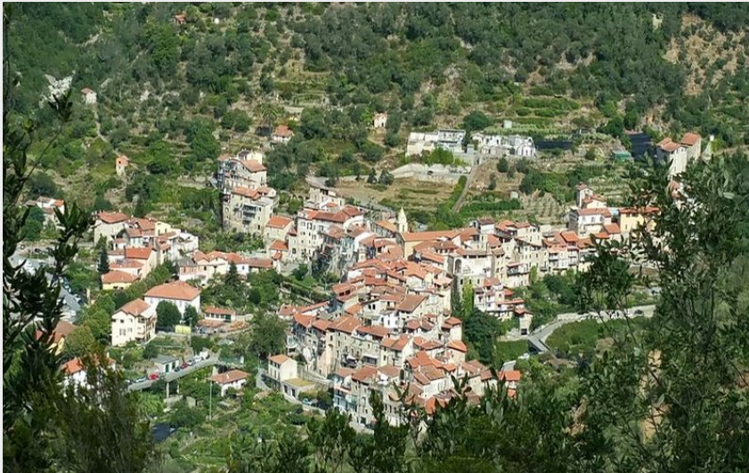
Rocchetta vue de haut (Destination Merveille)