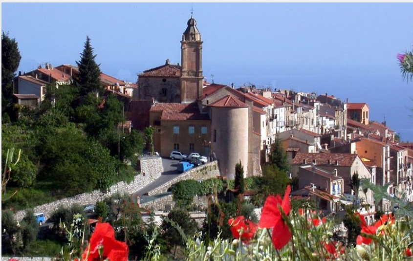
Randonnée Bévéra. Castellar (Mairie de Castellar)