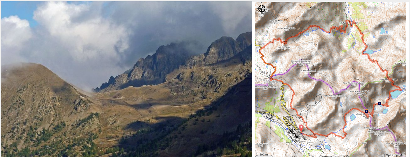
Randonnée Isola. Le col de la Lombarde, (2351 m), ennuagé sur le versant d'Isola en début d'automne.

Les lacs très nombreux, creusés dans les cirques glaciaires, appellent à la pause et à la contemplation. Les sommets élancés reflètent leurs cimes dans ces eaux immobiles.