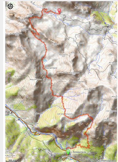
Randonnée Stura. Le Val Stura, Val Gesso et Tinée, Sommets émergents d'une mer de nuages. Entre Alpi Maritime et Mercantour.