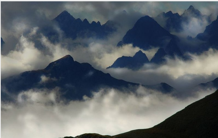
Randonnée Stura. Le Val Stura, Val Gesso et Tinée, Sommets émergents d'une mer de nuages. Entre Alpi Maritime et Mercantour.