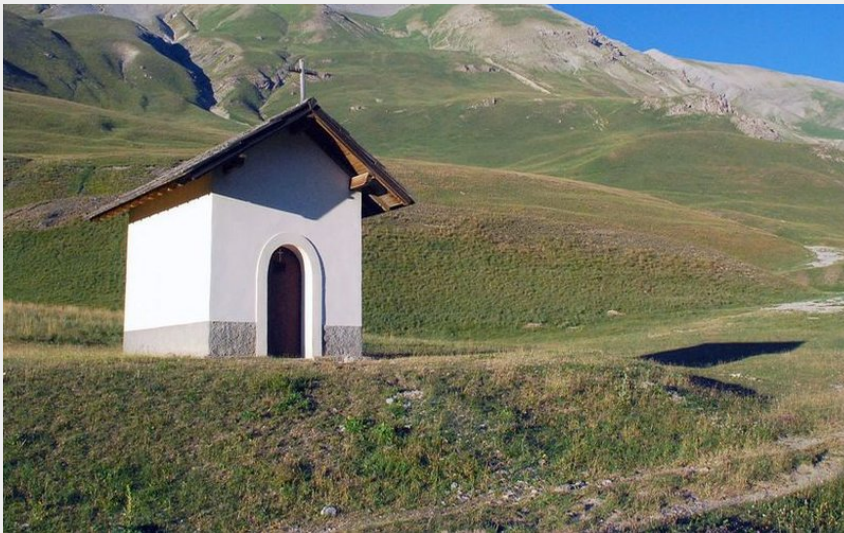
Randonnée Ubaye. La chapelle de la Madeleine au col de Larche