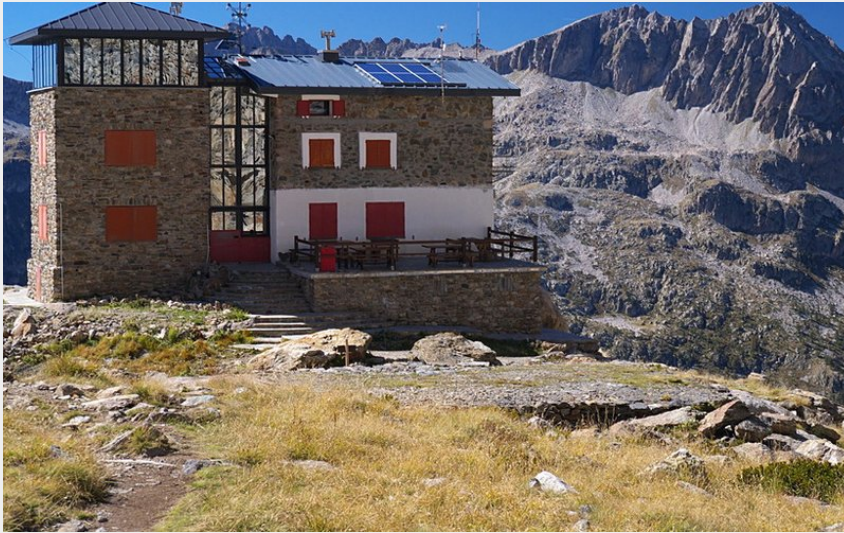
Il Rifugio Remondino (Roberto Pockaj)