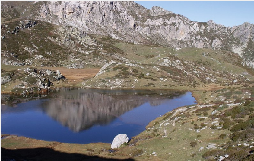
Il maggiore dei Laghi della Brignola (Roberto Pockaj)