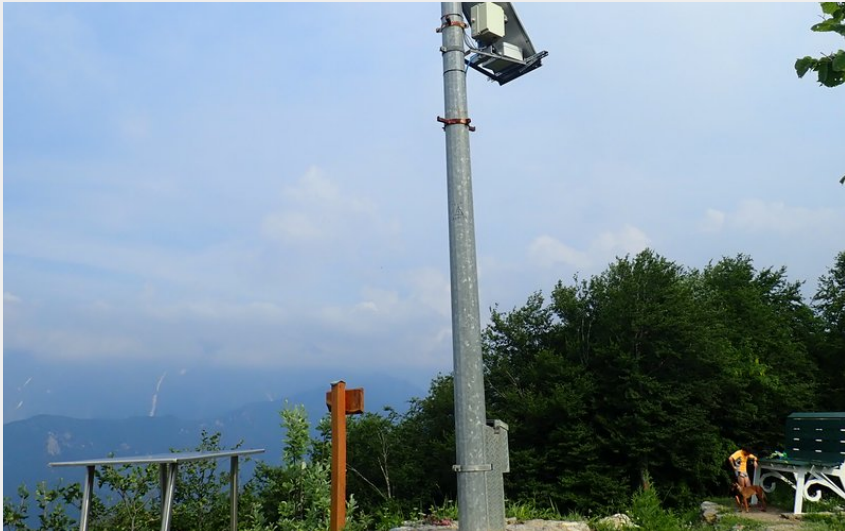
Madonna della Luce e la grande panchina (Volontari SVT)