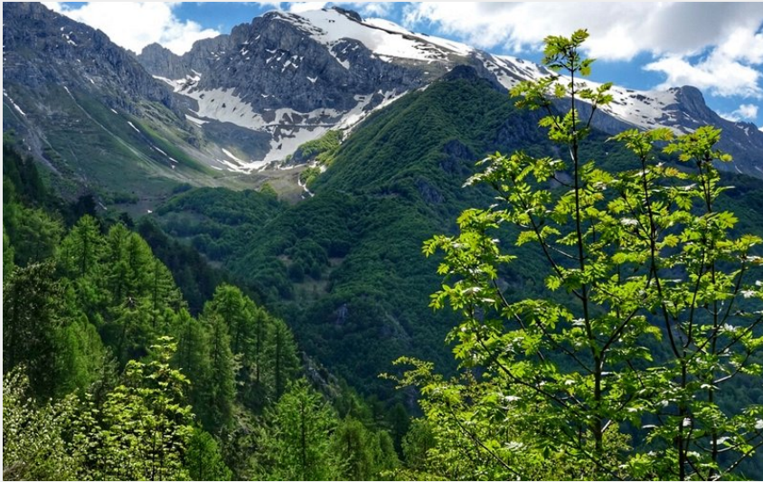
Panorama sugli impianti abbandonati del Cros e su Cima della Fascia (Irene Borgna)