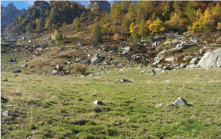
L'Alpe di Perabruna su cui domina il Rifugio Manolino (Roberto Pockaj)