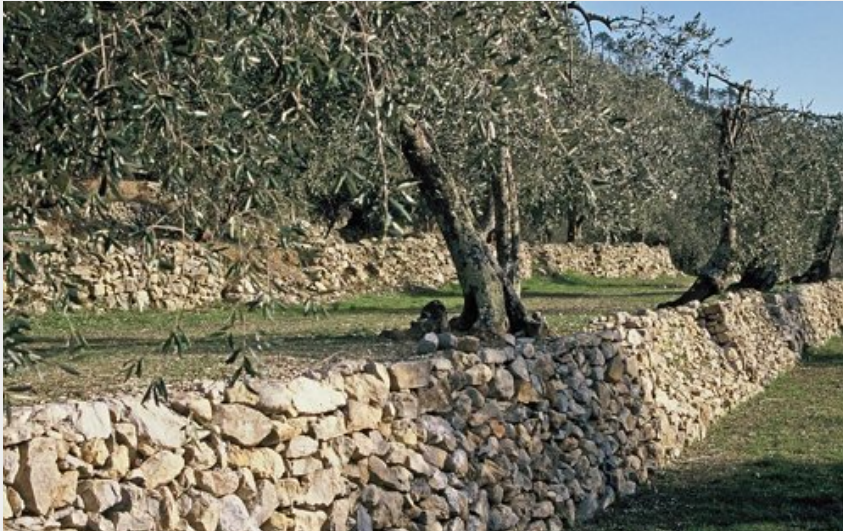
Restanques d'oliviers à Libre (ROSSI Gilbert)