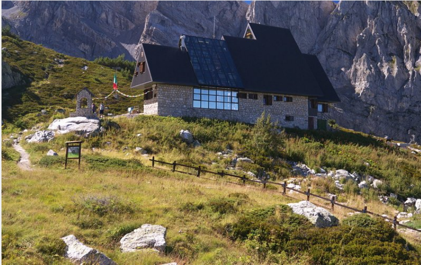
Credito fotografico : Il Rifugio P. Garelli (Archivio APAM)