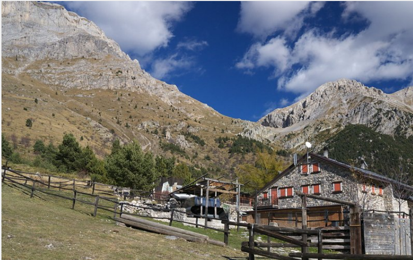
Il rifugio Mongioie