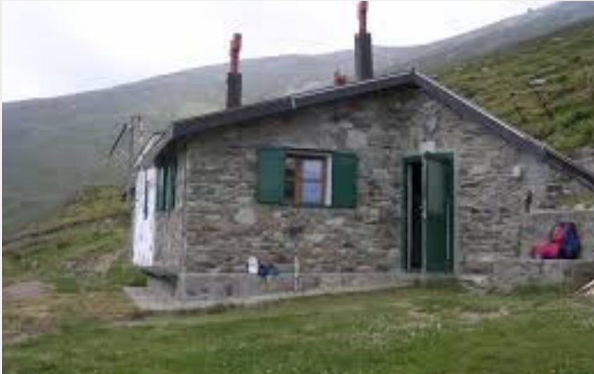
Credito fotografico : Il Rifugio Valcaira (Archivio APAM)