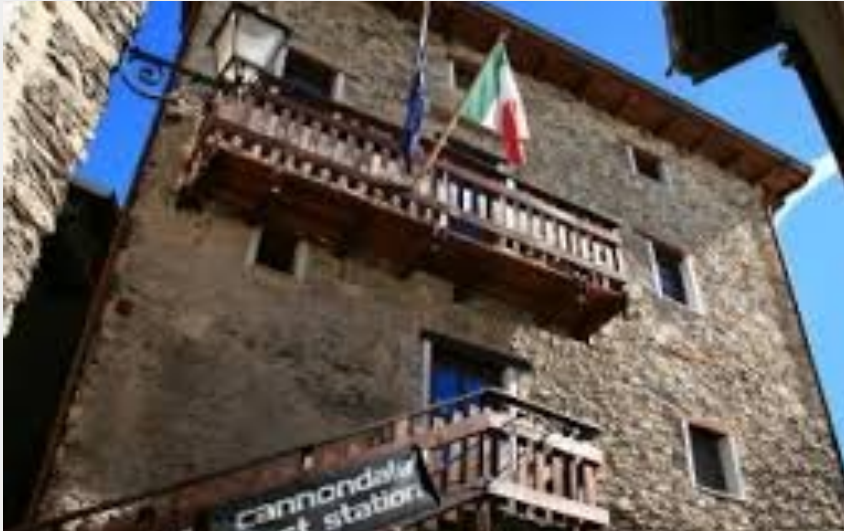
La porta del Sole