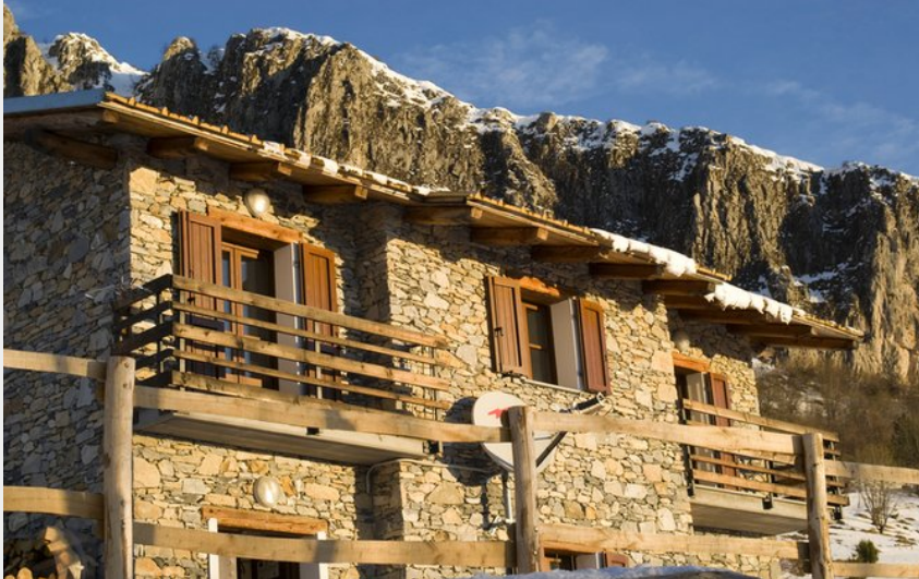
Il rifugio al tramonto