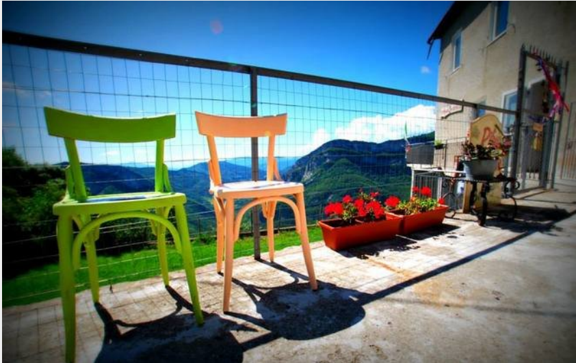
L'esterno del Rifugio