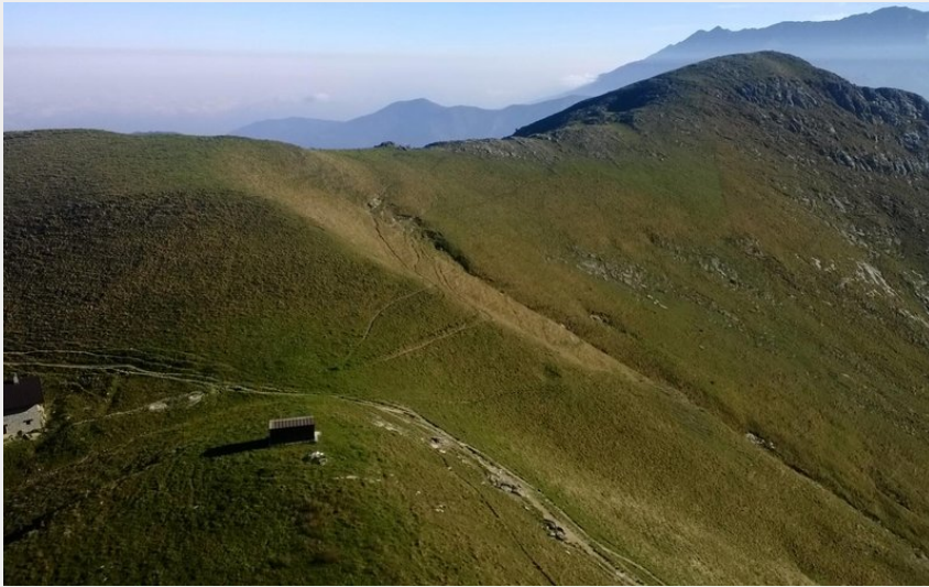
L'ambiente del Rifugio Balur