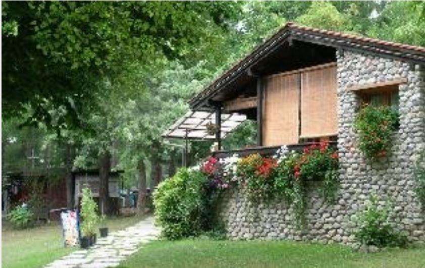
L'ingresso del campeggio