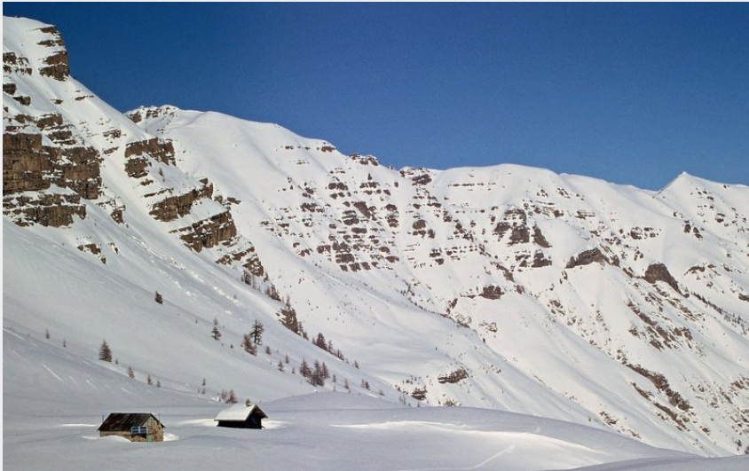
Refuge de Gialorgues en hiver