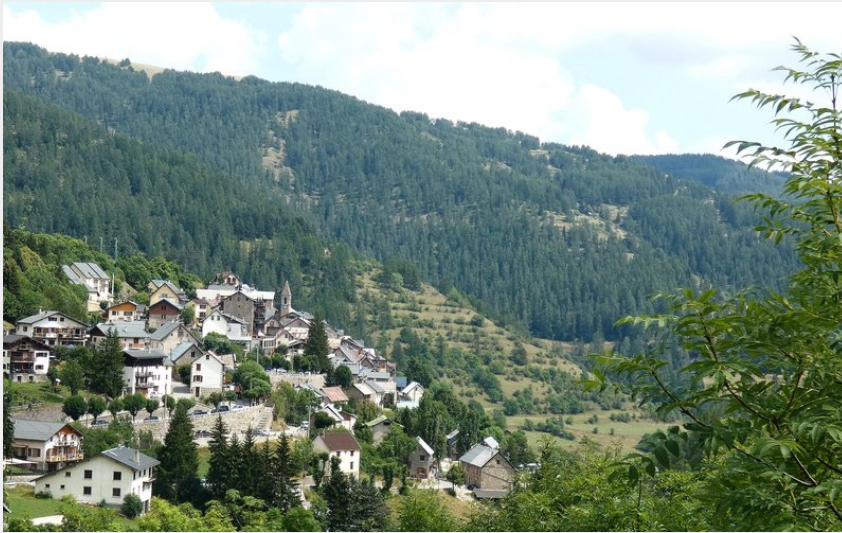
le village de Beuil