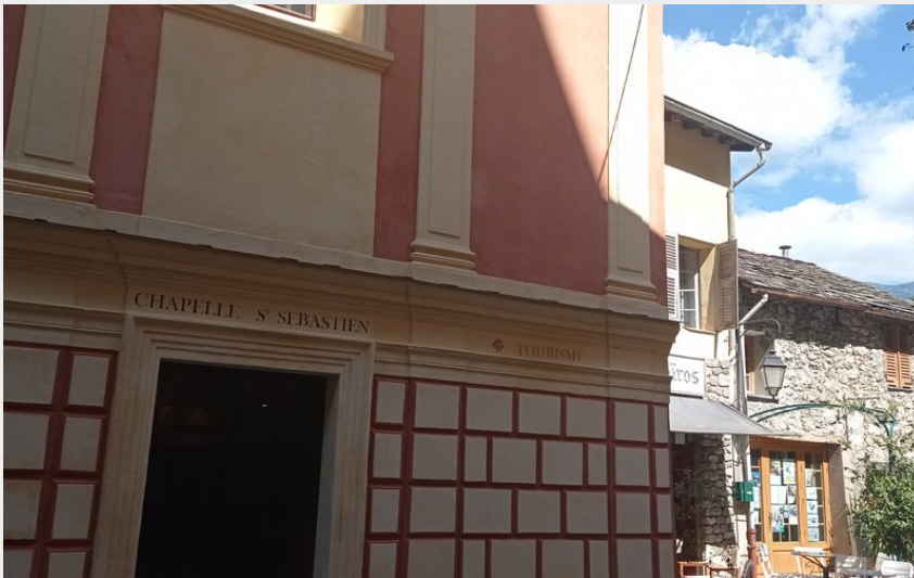
Credito fotografico : Chapelle des pénitents rouges Saint-Sébastien - Point info tourisme (© OTC MRM)