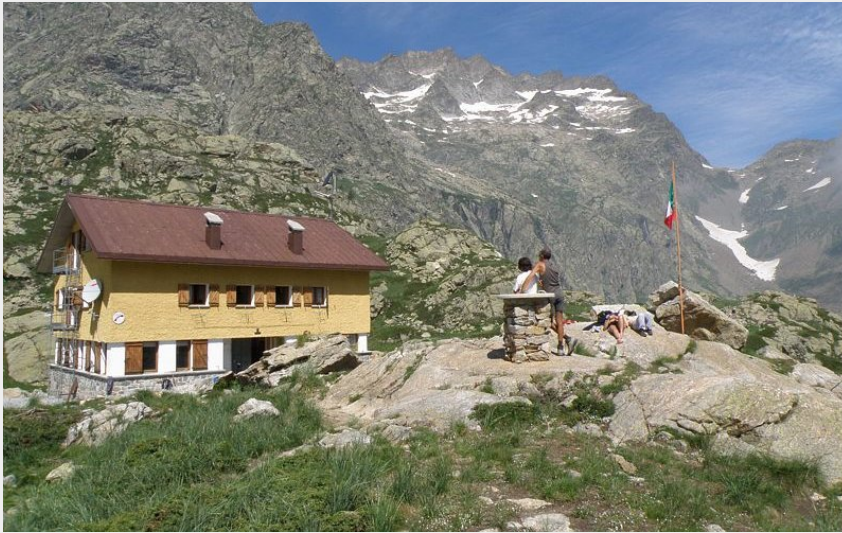
Le refuge Genova