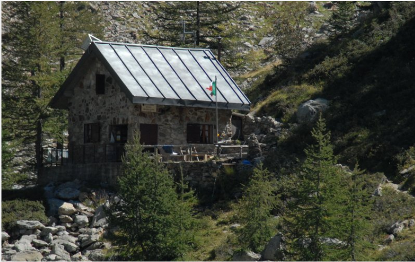
Le refuge Regina Elena