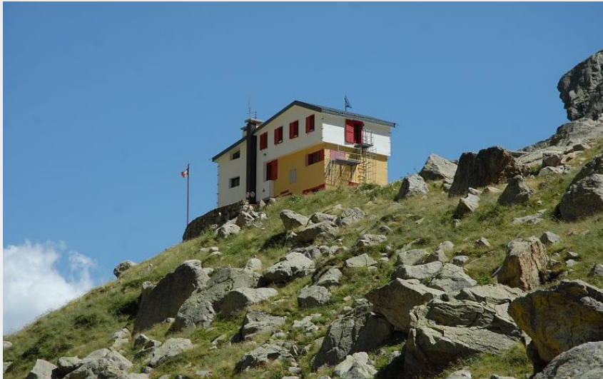
Le refuge Soria