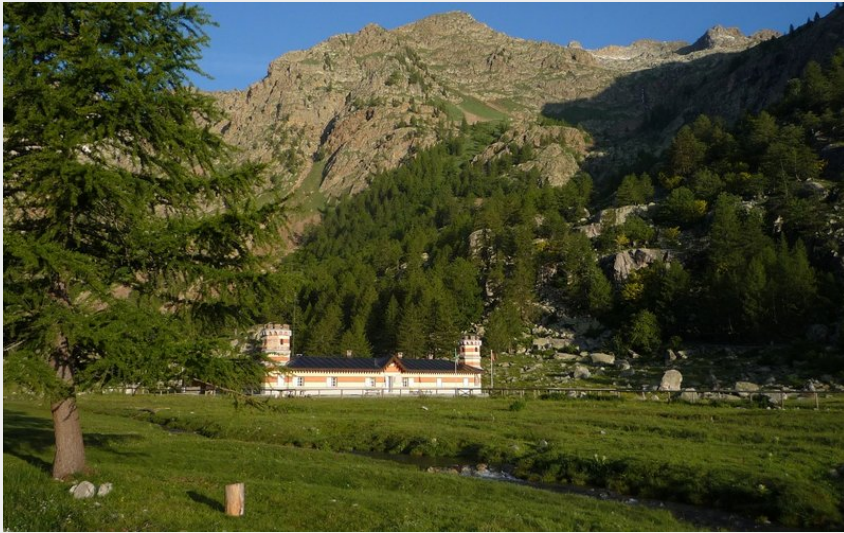
Le refuge Valasco