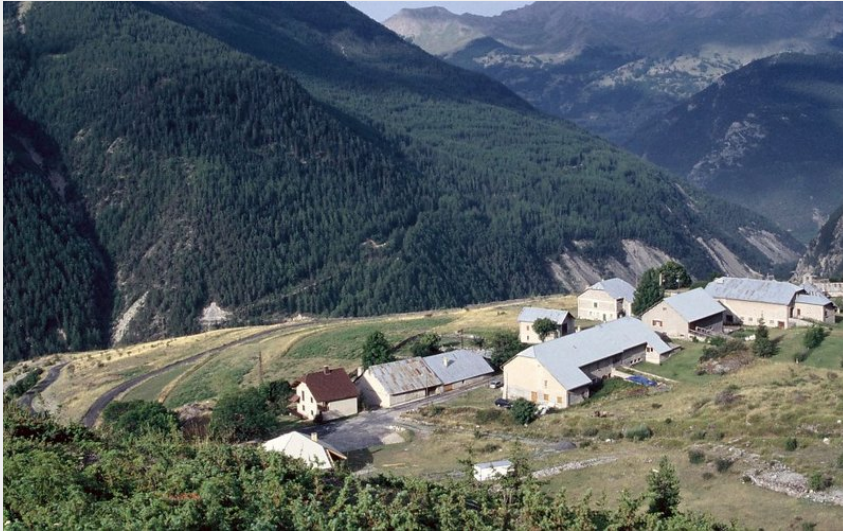
Vue plongeante sur le hameau de Saint-Ours (Meyronnes), sentier de la Rochaille (ESTACHY Robert)