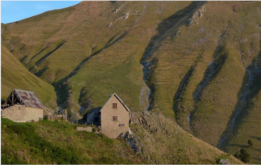
Vacherie pampriasque au mois de septembre (MALTHIEUX Laurent)