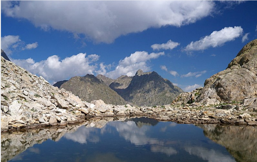
Uno dei due laghetti nei pressi del Colle di Fenestrelle (Roberto Pockaj)