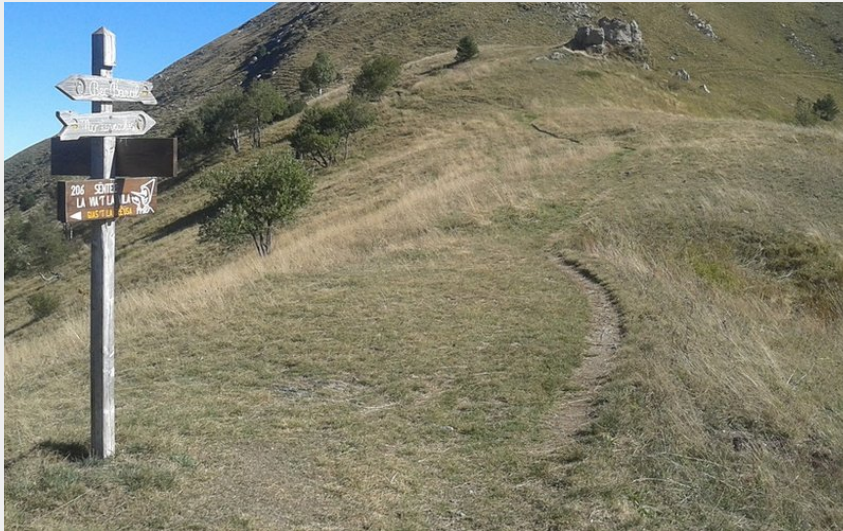
La dorsale prativa che sale al Monte Vecchio dal Colle Arpiola (Roberto Pockaj)